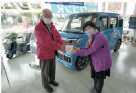
多くの企業の皆様にもご協力いただいています