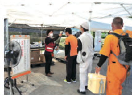
コロナウイルス感染対策をしながらの運営