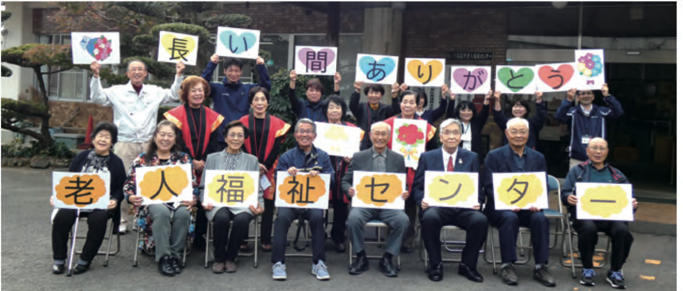
高尾野老人福祉センター 閉所風景