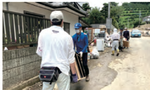
家財道具の搬出・撤去作業