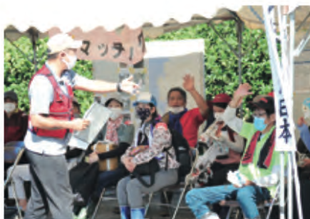
たくさんの方が参加されました