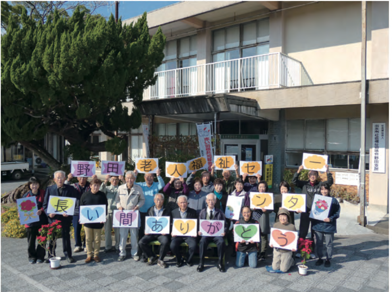
野田老人福祉センターの閉所風景