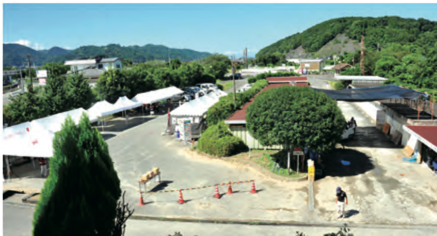
災害ボランティアセンター 全景