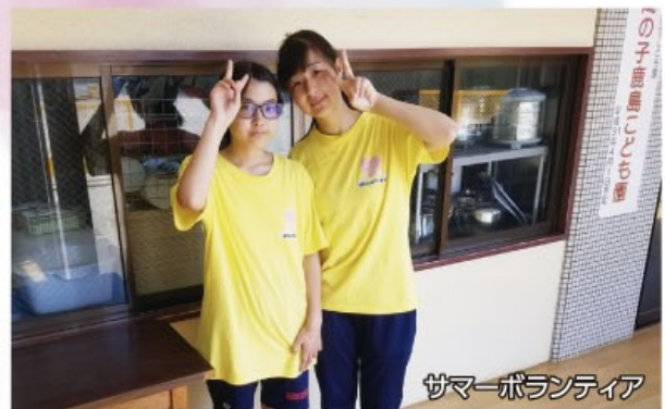
サマーボランティア