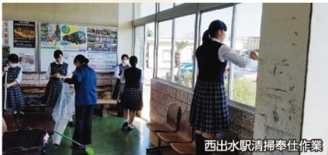
西出水駅清掃奉仕作業

また、コロナウイルスの影響で昨年と今年は思うように活動出来ていませんが、感染対策をしっかりと行い、自分のできる範囲でボランティア活動に取り組んでいます。