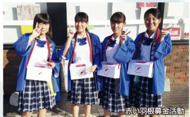
赤い羽根募金活動