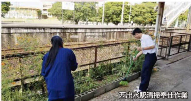
西出水駅清掃奉仕作業