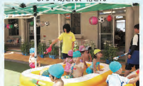
プール遊びのお手伝いは楽しく！