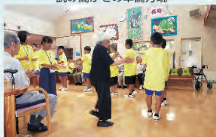
一緒に野田音頭をおどりましょう