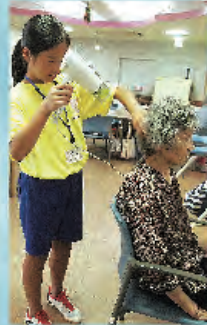
ドライヤーの熱に気をつけて