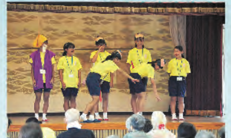
よっ！助さん、格さん