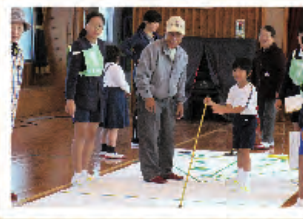
ふれあいレクリエーション