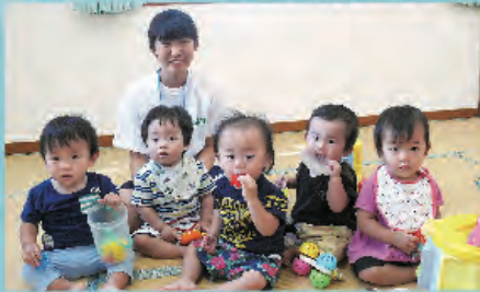
かわいい!五つ子ちゃんみたい