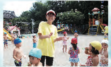
シャボン玉とはじける笑顔