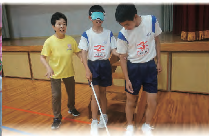
福祉体験学習 高尾野中学校 5頁