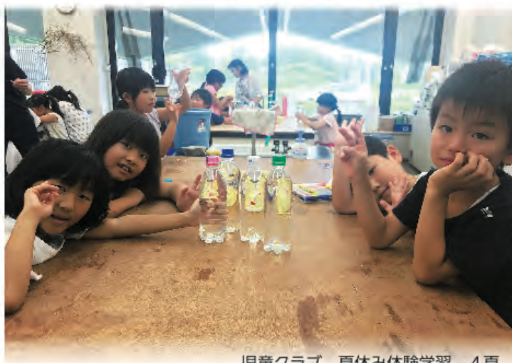
児童クラブ 夏休み体験学習 4頁