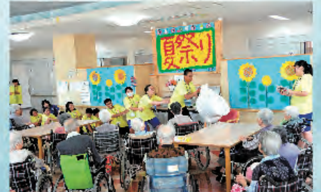
大きなカブがめけました