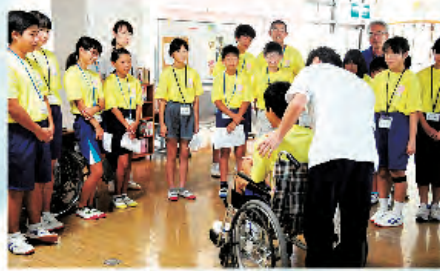
まずは声掛けからはじめましょう！

出水の里、ニューライフいずみ、鶴寿園、 ラ・フォンテいずみ、鶴寿会たかおの、 野田の郷、てまり、いこい、つどい、 暖らん、野菊