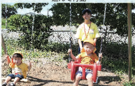
ブランコ遊びはなつかしく。