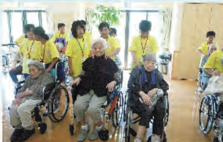
利用者の方も気持ち良さそう