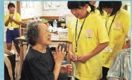
「あのね。教えてあげたい事があるのよ。」