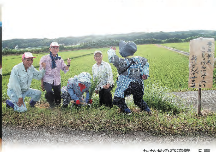
たかおの交流館 5頁