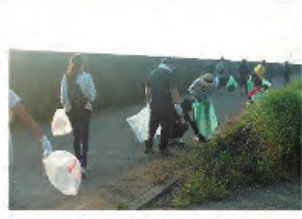
地区クリーン作戦