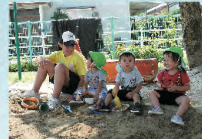
砂遊びももっとやろうよ