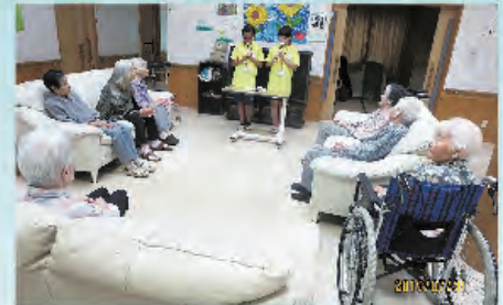
リコーダーで懐かしい曲をお披露目