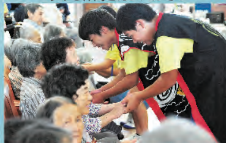
来年また会いましょう