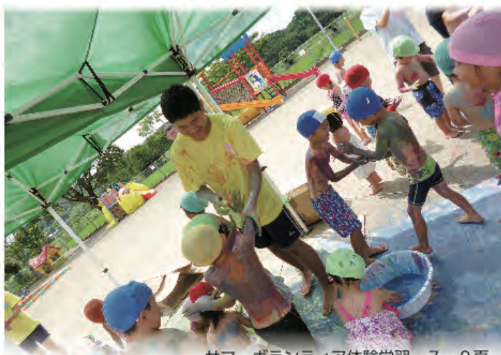
サマーボランティア体験学習 7～9頁