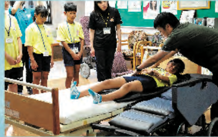
こうすると無駄な力はいりません