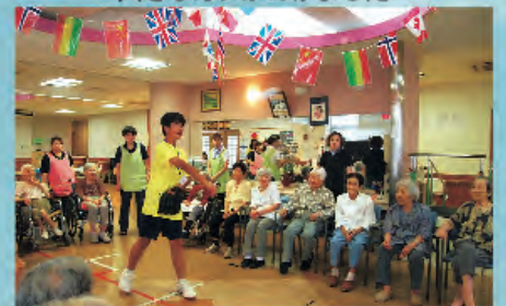
キャッチボールを披露します。