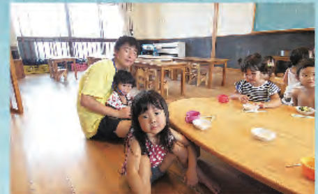
お兄ちゃんに抱っこ