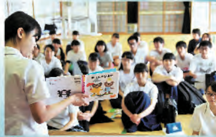
皆の前では緊張しました