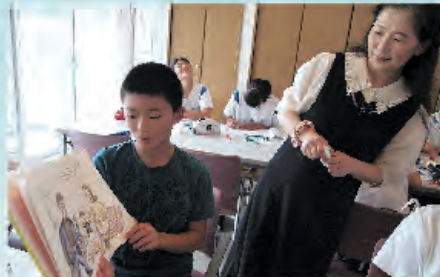
読み聞かせの準備万端