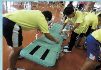
お掃除もボランティア