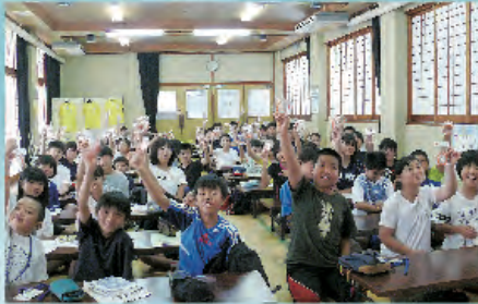
認知症サポーターリング取得したぞー!