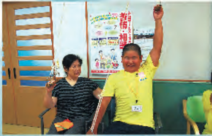
背中を伸ばしなさい!