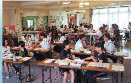
今年も仲間とガンバルぞ！