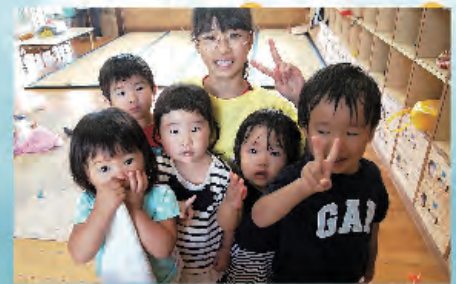
たくさん遊びましょう。