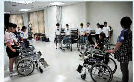
車イスを操作してみましょう