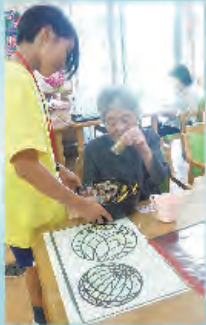
お茶の時間 おひとついかが？