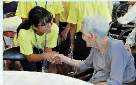
元気でいてくださいな