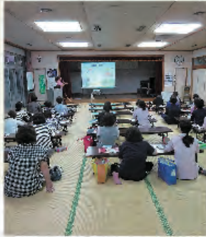
6月に実施した“口腔ケア”講習

出 水市社会福祉協議会では、介護職員を対象にした合同研修会を毎月開催しており、スキルアップや情報交換などを行っています。9月18日(水)には出水消防署石坂分署の消防職員を招き、救急法などの緊急時の対応について学びました。 通い、泊り、訪問の3つの利用者に必要なサービスを柔軟的に提供する「暖らん」、在宅と同じように利用者の方々にあった生活支援をおこなう「野菊」、利用者宅での介護サービスを行う「訪問介護・入浴」、施設やサービス内容は異なりますが、利用者・ご家族の方が安心できるようなサービス提供は共通であり、最も重要であると考えています。 今後施設の垣根を越えて、たくさんの方の情報を共有しながら、安心・安全な介護サービスを提供できるように努めていきます。