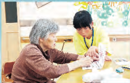
何色が好きですか。