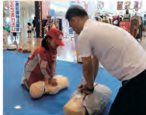
[World First Aid Day 2019] 人形での胸骨圧迫の練習風景 9月8日 オブシアミスミ

日本赤十字社の活動は、ボランティア、医療、救援活動、復興支援、献血など国内外で多岐にわたりますが、その活動はみなさまからの「活動資金」によって支えられています。日本赤十字社出水市地区では令和元年度も自治会のみなさまをはじめ関係各位のご支援・ご協力により、多くの会費を納めていただきました。ここでは多額（5千円以上）のご寄付をいただき、掲載について了解をいただいた方々のご芳名を紹介させていただきます。