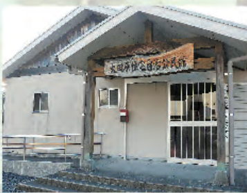
東出水センター (63-4581) 平日 8:30～17:15 ※土日祝日(年末年始)休み

高 齢者住宅安心確保事業とは、出水市のシルバーハウジング(自立して安心かつ快適な生活を営むことができるよう配慮された高齢者住宅)に居住する高齢者等に対し、生活指導及び相談、安否の確認、一時的な家事援助、緊急時の対応、関係機関との連絡等の在宅生活を様々な形で支援する事業です。 本会では、太田原自治公民館内の在宅介護支援センター「東出水センター」に支援員を配置し、居住している高齢者の方々の生活面・健康面での不安を、少しでも解消できるよう努めています。 また、「東出水センター」は高齢者の方々など住み慣れた地域の中で安心して生活できるように、各関係機関の調整役としての相談窓口にもなっています。シルバーハウジングに居住していない方でも在宅での介護について不安や悩みをお持ちの方は、気軽にご相談ください。