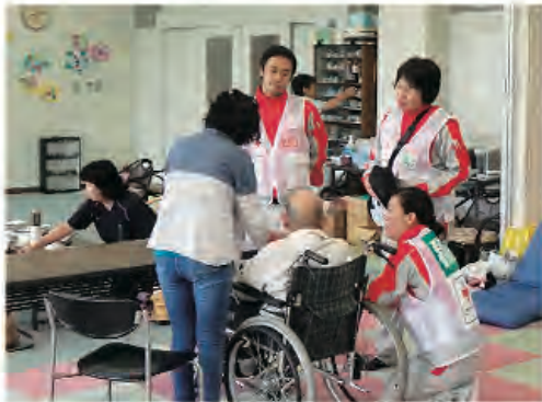
九州北部豪雨災害 9月1日 武雄市にて

近年、台風や豪雨災害等により多くの方が犠牲になるなど、常に自然災害と隣り合わせです。日本赤十字社出水市地区では、各地で発生した災害によって被災された方々を支援することを目的に義（救）援金の受付を行っており、令和2年3月31日現在で319,495円の義援金が集まりました。ご協力くださいました一般・団体・企業の皆さまに深く感謝申し上げます。皆さま方から寄せられた義援金は日本赤十字社を通じて被災された方々へ送られます。