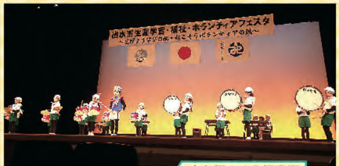
◦ 大久保さくら保育園