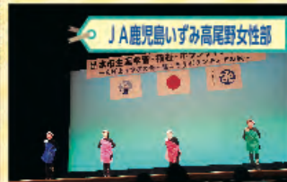
◦ J A鹿児島いずみ高尾野女性部