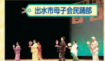
◦ 出水市母子会民踊部