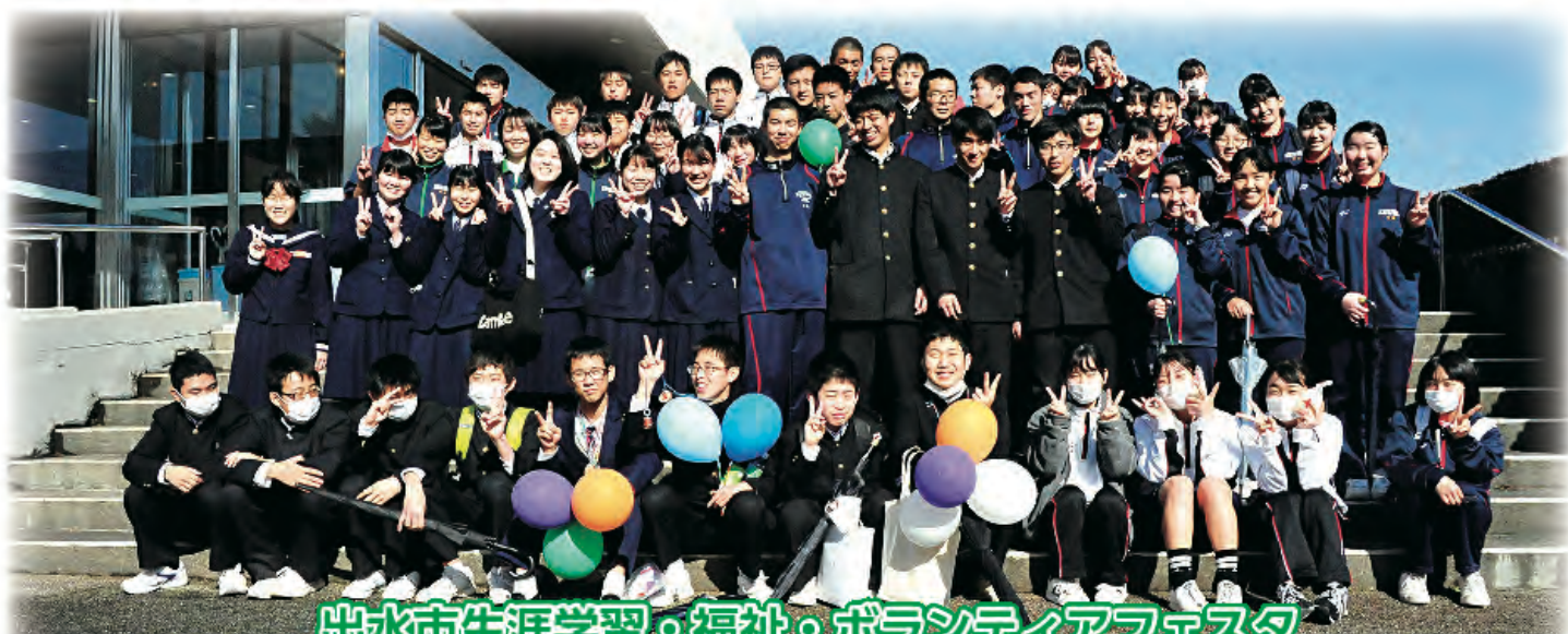
出水市生涯学習・福祉・ボランティアフェスタ