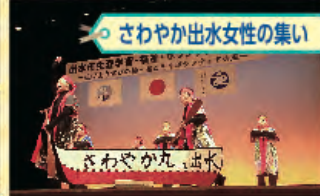
◦ さわやか出水女性の集い