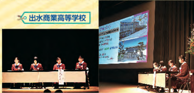
◦ 出水商業高等学校