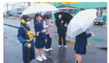
妊婦・高齢者の疑似体験で地域へ

学生は、「現在、最も力を入れている福祉事業は?」「介護現場の課題とは?」「地域が直面している課題や今後取り組みたいことは?」などと意欲的に質問をして、学びを深めていました。