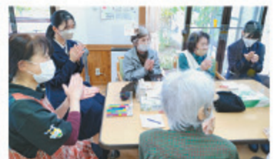
介護施設で利用者と交流